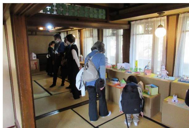
▲2022年11月 児童がヨドコウ迎賓館見学時に得た発想から制作した建築模型の作品展