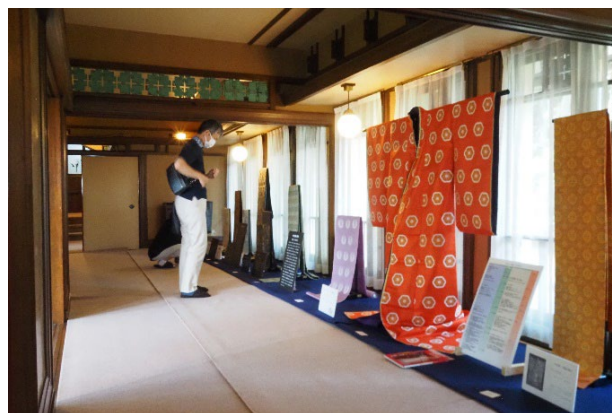
▲2022年10月 「HOS00展 ～1400年の時空を超えて～」